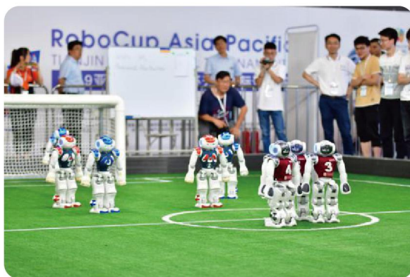
亚太机器人世界杯天津国际邀请赛