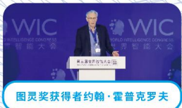
图灵奖获得者约翰·霍普克罗夫