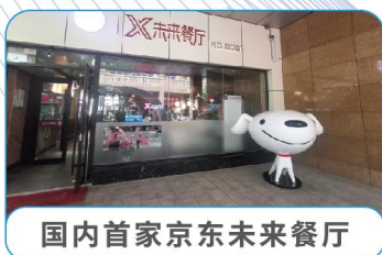
国内首家京东未来餐厅