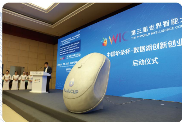
中国华录杯·数据湖创新创业大赛