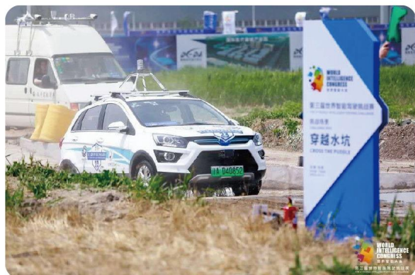
世界智能驾驶挑战赛