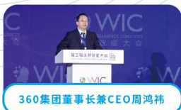
360集团董事长兼CEO周鸿祎