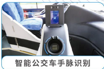
智能公交车手脉识别