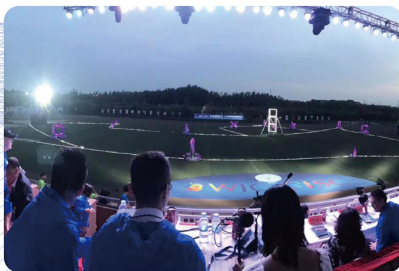
首届国际智能体育大会