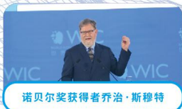
诺贝尔奖获得者乔治·斯穆特