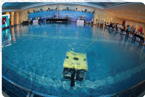
世界智能水下机器人挑战赛