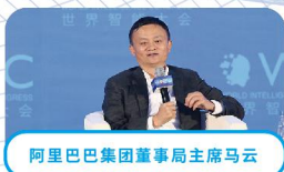
阿里巴巴集团董事局主席马云