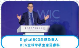
DigitalBCG全球负责人 BCG全球专项主席汤睿科