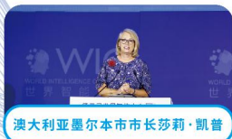
澳大利亚墨尔本市市长莎莉·凯普