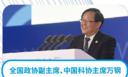
全国政协副主席、中国科协主席万钢