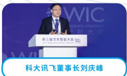
科大讯飞董事长刘庆峰